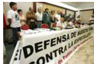
Miembros de colectivos ciudadanos informan, este jueves, de la concentración del 18 de noviembre.